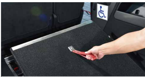
* Easy Use功能的坡道拉環