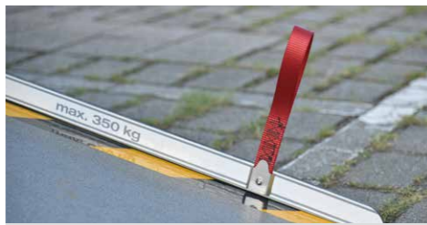
* Easy Use功能的坡道拉環