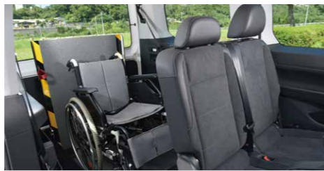
* 單人輪椅區大空間