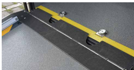
* AMF-Brunns 獨家設計斜坡跨板