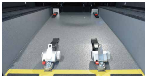
* 榮獲2020年紅點設計獎的輪椅固定裝置