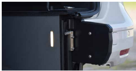
* 柔和暖色調的坡道LED照明燈