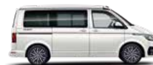
香草白 | B4B4