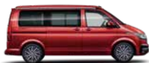
鋼琴紅 | 1919