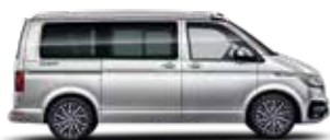
璀璨銀 | 8E8E