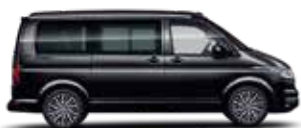
珍珠黑 | 2T2T