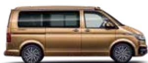
古銅金 | 5A5A