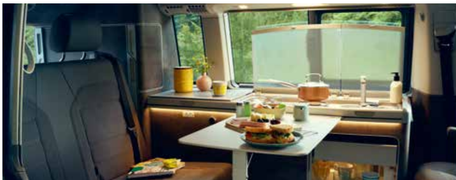
隱藏式摺疊桌(收納於右側滑門) / 隱藏式折疊椅(收納於尾門)

隱藏式摺疊桌和2張折疊椅子能當戶外餐桌使用，不用時能巧妙地分別收納至右側滑門和尾門內的隔板中以節省空間。