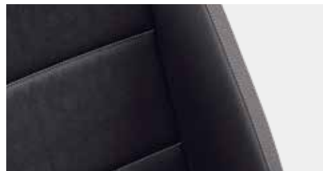
Art Velours 高級絲絨座椅 (TDI車款)