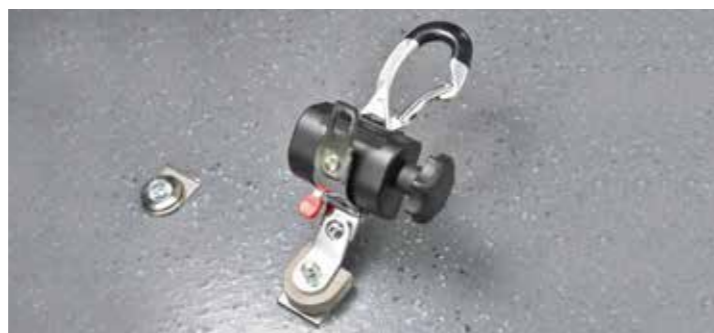
* 易拆卸輪椅固定裝置