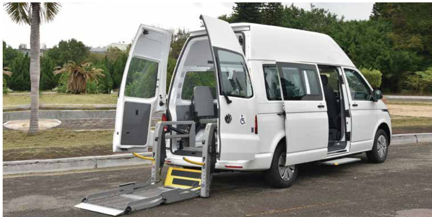
乘客艙高度192公分 * 德國進口AMF-Bruns Panorama升降機

以德國福斯商旅安全可靠的Kombi車款開發，提供舒適的行車感受及創新的引擎科技；全新的節能引擎帶來的省油效能，搭配可靠的五速手排變速系統，提供7人座或8人座車型符合不同載運需求。