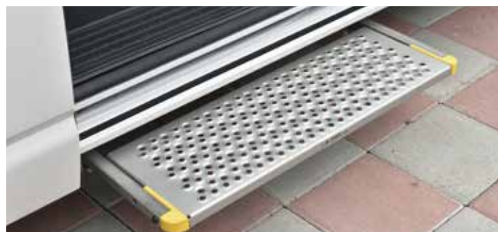
* 德國進口AMF-Brunns電動伸縮踏板