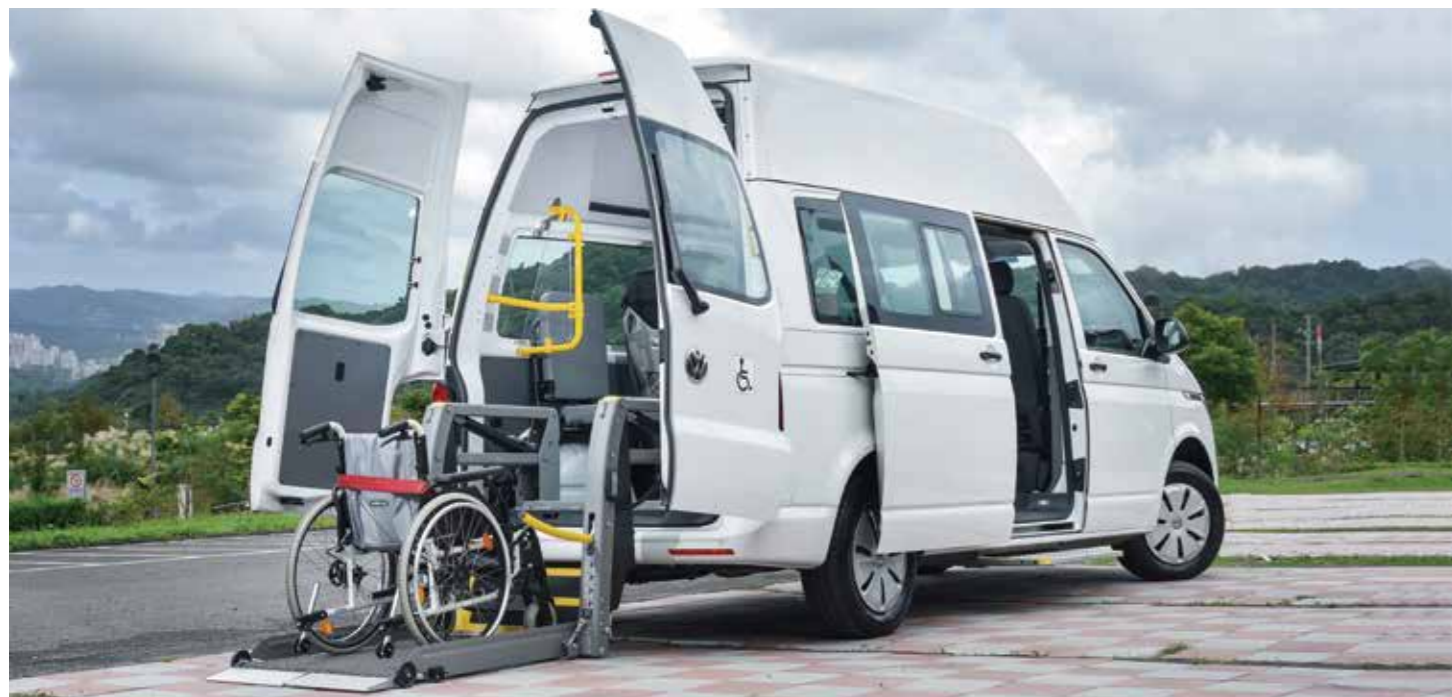
乘客艙高度192公分 * 德國進口AMF-Brunns Split升降機

Kombi IPC 配備雙前座SRS氣囊、ESP電子行車穩定系統及MCB二次撞擊預煞系統等安全科技，並搭載歐洲最大輔具製造商德國AMF-Brunns公司、通過歐盟認證標準的輪椅套件，以最完整的保護提供最高規格的行車安全。