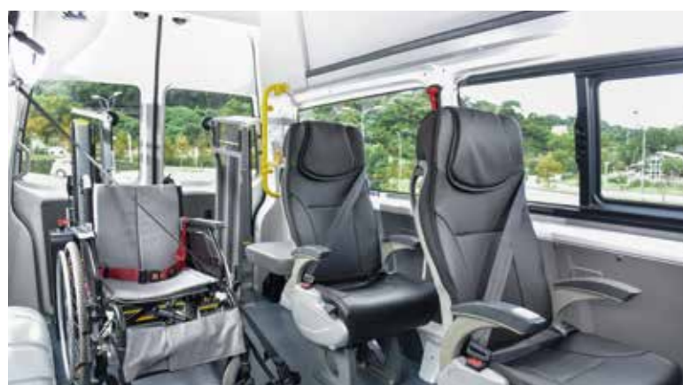
* 7人座車型配置2張獨立座椅及1座折疊椅