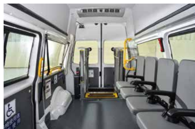
* 8人座車型配置4張折疊椅