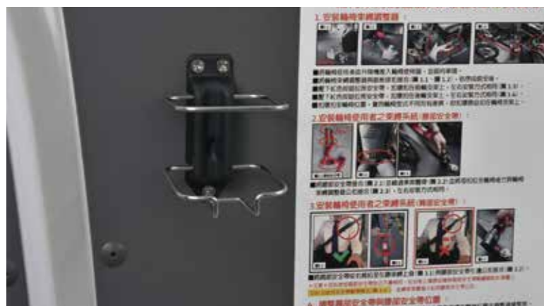
* 乘客艙獨立置杯架