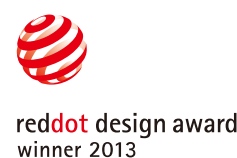
reddot design award winner 2013