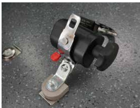
* 易拆卸輪椅固定裝置