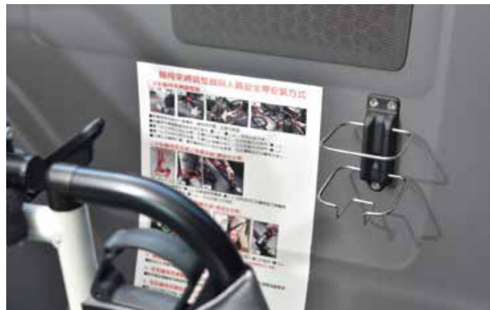
* 乘客艙獨立置杯架