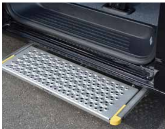
* 德國進口AMF-Brunns電動伸縮踏板