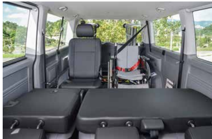
* 8人座舒適大空間(7位乘客及1位輪椅乘客)