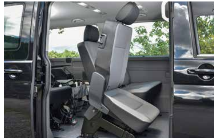
Easy Entry簡捷上車功能(圖為配備單滑門車型)