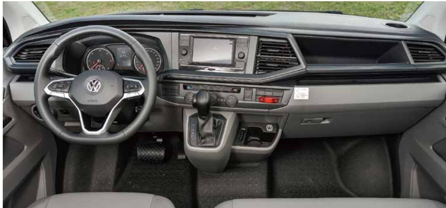
豪華儀表及副駕駛座雙人座椅

以Caravelle車款為基礎，配備全新的節能引擎及剎車動能回收系統，創造省油的科技標準。