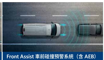
Front Assist 車前碰撞預警系統 (含 AEB)