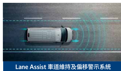
Lane Assist 車道維持及偏移警示系統