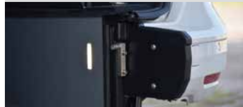
* 柔和暖色調的坡道LED照明燈