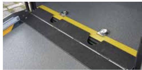
* AMF-Brunns 獨家設計斜坡跨板