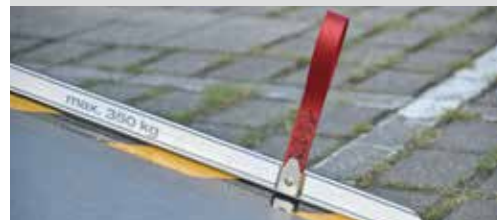
* Easy Use功能的坡道拉環