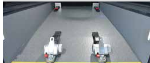
* 榮獲2020年紅點設計獎的輪椅固定裝置