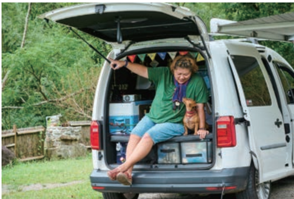
劉劉劉與愛犬翁來幾乎形影不離，翁來好比她的安全氣囊，有牠陪伴就不孤單。

這幾年劉劉劉把「及時行樂」四個字奉為圭臬。「我的好姊妹罹癌不到一年便離世，給了我重重一擊... 談以後不如馬上去做，現在的我，只要想出去玩，我的行動力是非常旺盛的。」劉劉劉認為女人的性感不在於身材，而是要做自己、愛自己、給自己最充足的自由，「在福斯商旅強大功能的守護下，我得到最高等級的自由，它帶我去更多地方也玩得更深入。」