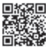
相關影片 ▶ 《福斯商旅 75 周年生日快樂》

簡單來說，在台灣如果見到 T1 或 T2 這樣有歷史年份的車款，通常都屬於比較靜態的收藏品，但在本次的 VW Bus Festival 之中，第一次見到這麼多的 T1、T2 可以勇健的在道路行駛，車主也將車輛當成是日常生活的一部分，實際開著這些經典車在歐洲各地旅行、露營，其實這不也是 VanLife 的真諦嗎？人與車輛建立互相信任的夥伴關係，而不是由其中一方支配另一方，這樣才是人車生活能夠長久經營的關鍵因素。