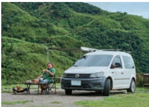
劉劉劉笑著說，有駐車冷氣，出遊不再受酷夏影響，到哪都能舒適入睡。

她笑言，原本打算退休後，買塊地、養一頭牛，看牛吃草，「現在想想，何必呢，我開著 Caddy Van 四處去看牛吃草還比較有樂趣。」問劉劉劉不停地環島，膩了嗎？她說，景點會膩，但人情味永遠不會膩，旅途中認識社會上不同觸角的人，豐富了她的生活，有時候一個景點一去再去，是為了去見見老朋友。「而且自從有了 Caddy Van，我發覺車宿實在太好玩了，我決定這輩子我都要開露營車。」劉劉劉堅定地說。