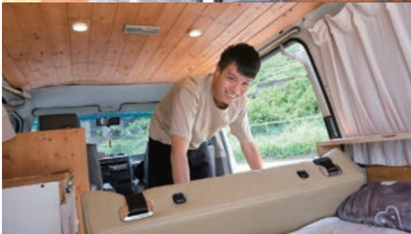
Savy 看影片自學改裝，車子裡的每個角落，從設計到製作都是他親力親為的成果。