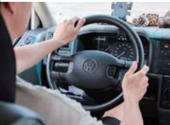
車齡超過 20 年的 T4， 滿載著 Savy 與女友出遊的 珍貴記憶。

「自己動手改裝，除了省錢之外，更大的回報是有滿滿的成就感，看著這台車越來越符合自己理想中的模樣，跟它也產生了非常深刻緊密的情感連結。」