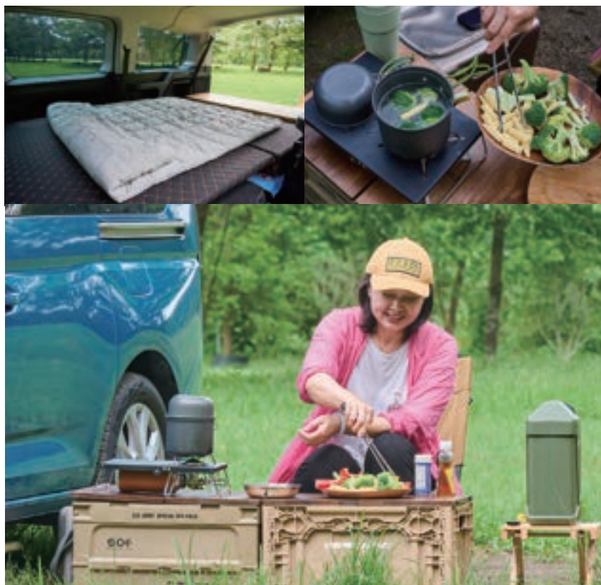
安卓很享受在蟲鳴鳥叫的大自然配樂下、做料理的愉悅感。