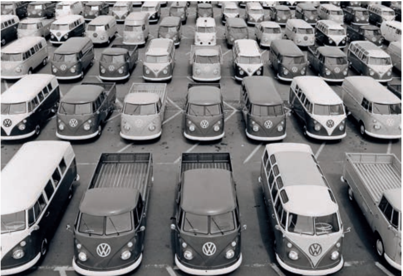
福斯集團德國漢諾威生產線自 1955 年開關，同一生產線見證了 Transporter 車系一路的輝煌。

時至 1967 年，在生產超過 180 萬輛 T1 之後，更時髦、更安全的第二代 Transporter（T2）在經過大幅度重新設計後，於各方注目上市。本車除了強化擋風玻璃，並加大窗戶以提高透光度及視野廣度之外，也提升了體積，讓內部空間運用更自在。採用水平對臥汽缸、氣冷結構的特殊引擎，成功將動力提升到 47 匹馬力輸出，讓 T2 車型的時速達到 110 公里，成為兼具造型、實用性，還具備有性能表現的全方位車款。