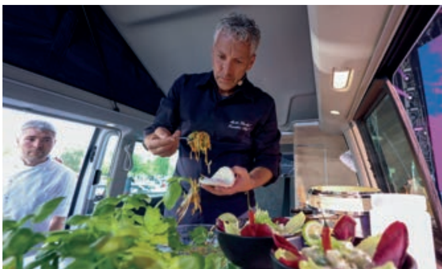
（上圖）辨別 T1 與 T2 的方法很簡單，前面有兩扇窗戶的是 T1，整片式前擋玻璃的是 T2；（中圖）車主表示這輛警車是非賣品，但其實在外頭買得到縮小版模型就是了；（下圖）靜態的活動也有，像是邀請米其林星級大廚現場教學料理。