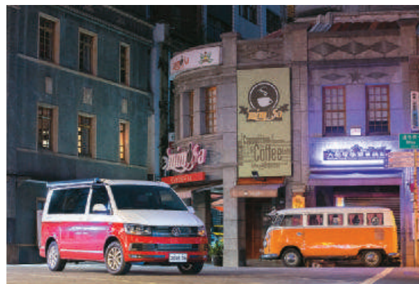
精彩的雙色塗裝和專屬配備，福斯商旅推出的全新Multivan車款向經典致敬。

對應現代人對於科技載具的重度需求，Multivan全車系配備Composition Media音響系統，整合6.3吋彩色螢幕、