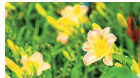
嘉德萱草花田的金針花，都是經過改良的平地金針花種，和我們之前看到的金針花相比更龐大。