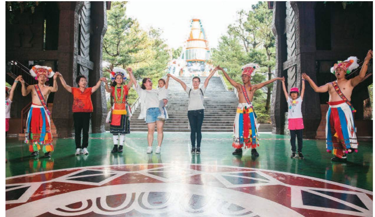
1. 九族文化村目前主要的遊樂設施有 20 多項，今後仍將不斷推陳出新。 2. 九族文化村行政大樓前，購入約 5 年的 T5 作為園區內擔當重任的醫護車。