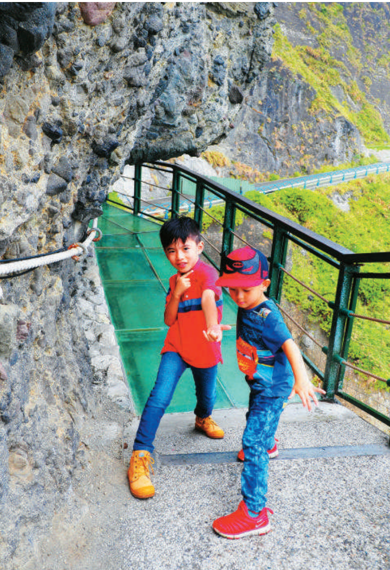
最刺激的玻璃步道即將到來，這兩個小蘿蔔頭，竟然一點也不害怕，扮起了超級英雄來。