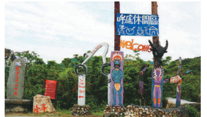
「呼庭」的意思就是阿美族語「放牛羊的地方」。

這次的花蓮行程，因為有帶小朋友，所以我沒有排太多太滿的景點，而是讓小朋友可以慢慢的玩。從台北搭乘太魯閣號到花蓮火車站，只要二個多小時的車程就可抵達，和以前來花蓮相比，真的節省了不少乘車的時間，而我們包的福斯商旅 T6 Caravelle 也來車站接我們了。