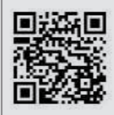
台灣福斯商旅 官網

台灣福斯商旅針對官網內容編排也進行大幅度調整，計畫選購福斯商旅車款的準車主，可依照自己的需求先閱讀商品特點，接下來便可預約試駕，並且進行產品目錄下載；透過順序重新排列，提供瀏覽者更棒的全新體驗，同時感受福斯商旅對客戶服務上所注入的用心和創意。