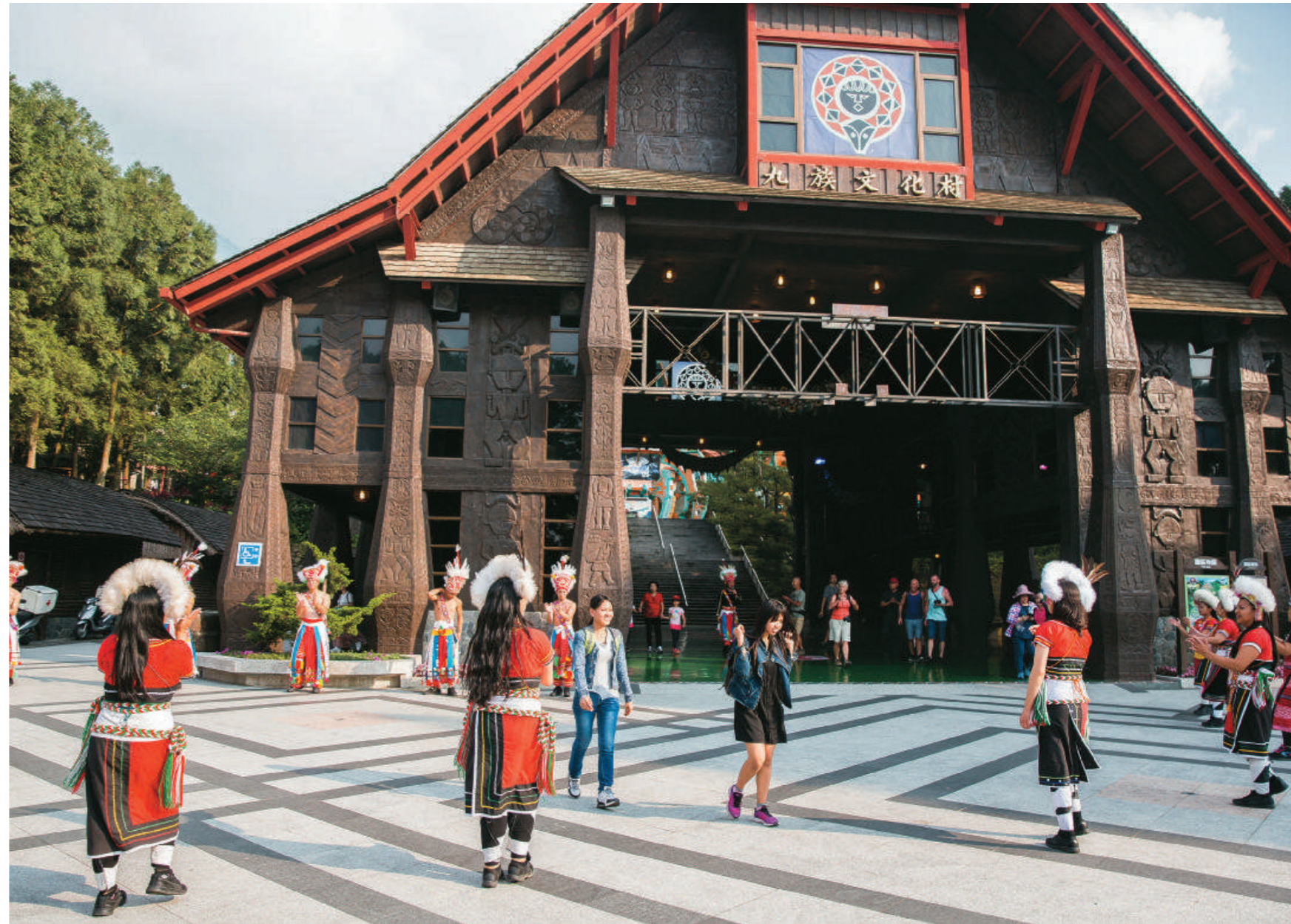
民國 75 年九族文化村開幕以來也並非一帆風順，九二一大地震及後來多次的颱風，園區都能復原重建，靠的是紮實經營所獲得的韌性。

創新，張協權主張「遊樂園要生存，就不能有老態」，若這座遊樂園讓人只想去一次，重遊率不佳，那市場很快就消失了。九族要讓遊客覺得「永遠有新意」，隔一段時間再來，還是有新鮮感。