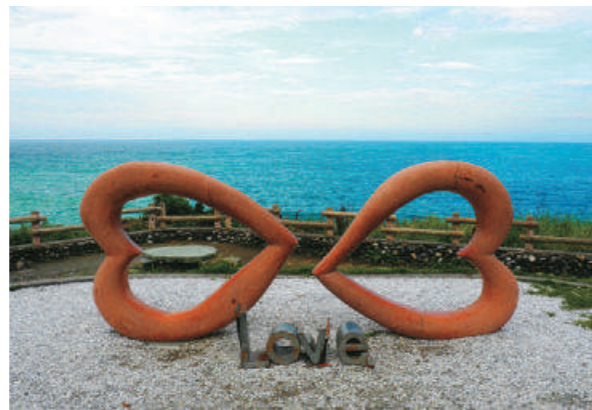
極浪漫的的石門班哨角園區的雙心石雕後便是無敵海景，情侶怎麼能夠不來！