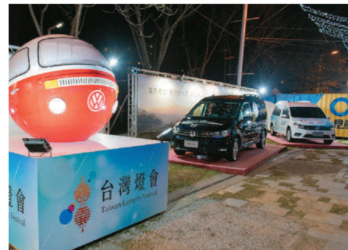
活動期間，台灣福斯商旅於 Caddy Maxi 展車區推出燈謎遊戲問卷活動，吸引了不少民眾踴躍參與。

遊嘉義燈會除了欣賞各式花燈外，還有另一活動亮點，就是台灣福斯商旅的有獎互動遊戲。現場所停放的正七人座 Caddy Maxi 後車室內裝載了「Footer 除臭襪」，民眾只要填寫問卷，猜測 Caddy Maxi 究竟裝載了多少雙襪子，就有機會獲得好禮，包括 Snow peak 露營組、Footer 除臭襪，吸引了許多民眾踴躍參與，也為燈會增添了有別於視覺享受的另一番樂趣新體驗。