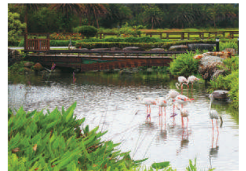
帶著孩子參觀紅鶴等都會區難得一見的動物，台開心農場就像個室外的生態桃花源。

以上就是我們這次的花蓮二日遊景點，是個適合親子同遊的行程，帶著小朋友也可以輕鬆玩，如果想知道相關的旅遊資訊，大家也可以參考「福斯商旅台灣」的旅遊資訊平台，除了租車、飯店接駁資訊外，也有不少一日遊行程建議，並且搭配著各縣市的飯店及租車服務，讓大家在旅行的時候，可以輕鬆的規劃，就算不自己開車也很方便，可以放心的玩台灣。