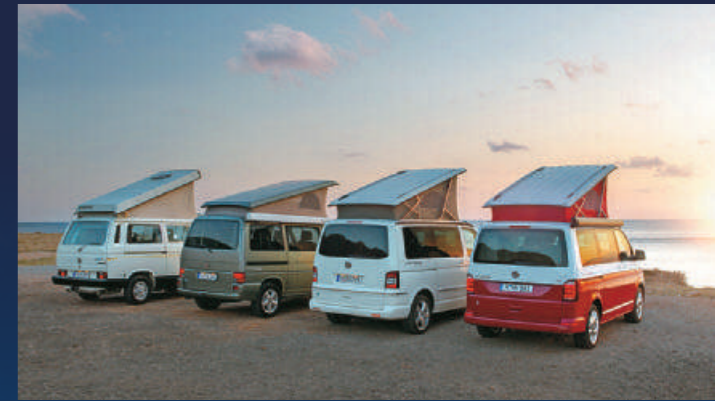
完美融合廂型車與露營車的各項特色，新一代California不僅有高效動力，同時還有更完備且舒適的車內空間和眾多配備。

科技力展現，同樣於動力表現中完美實踐。其中Beach與Beach 4Motion兩車型配備相同的2.0升直列四缸渦輪增壓柴油引擎，具備150ps/34.7kgm輸出動力，Ocean車型更導入雙渦輪增壓科技，更出色的204ps/45.9kgm動能隨伺在側。Beach 4Motion與Ocean導入新一代4Motion全時四輪驅動科技，Ocean額外加掛後軸差速器鎖定功能，增加