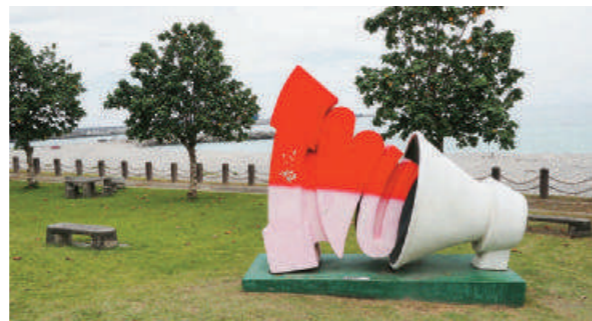
獨特的 3D 立體彩繪藝術相當應景，視覺上卻也十分跳躍。