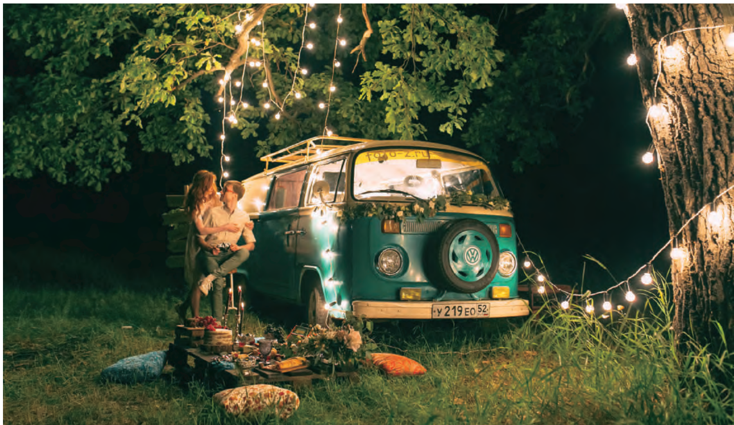
福斯商旅車款的經典形象深植人心，許多車主與車款有著無數美好回憶。

後的商旅車進行公路旅行，他們在海邊露營、沙灘上野餐，坐臥在大草原觀賞日落。這趟旅行，讓他們重新找回人生的意義。現在，夫妻倆依舊努力工作，但是嘗試放慢腳步，實現自己的夢想，並且為下一趟的旅行累積假期和旅費。