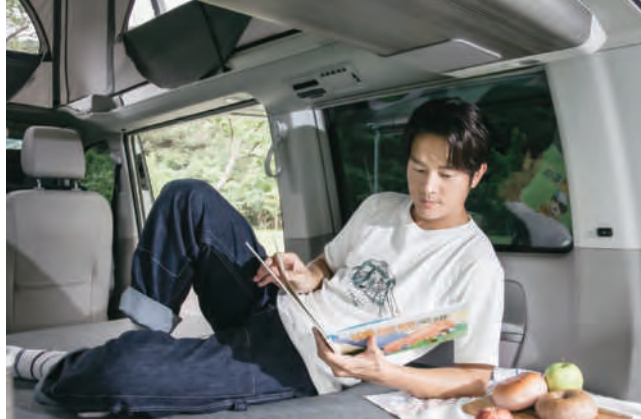
宥勝對於生活的想像，就是改變家的型態，與家人享受每一時刻帶來的驚喜與樂趣。