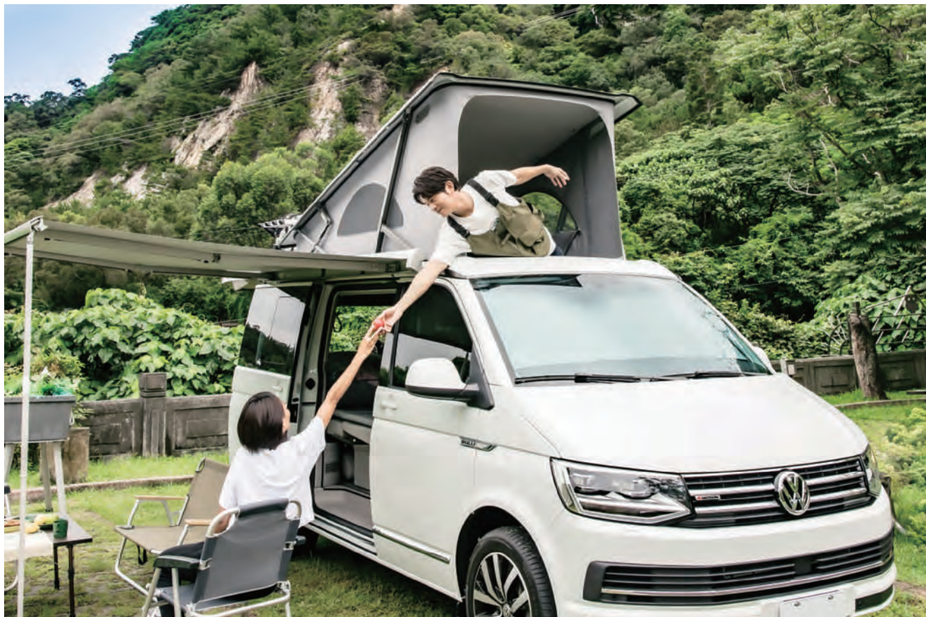
有了 California 的陪伴，宥勝一家人總是在車中享受最愜意的休息時刻，搭配著車外的風景，品味到生活的美好。