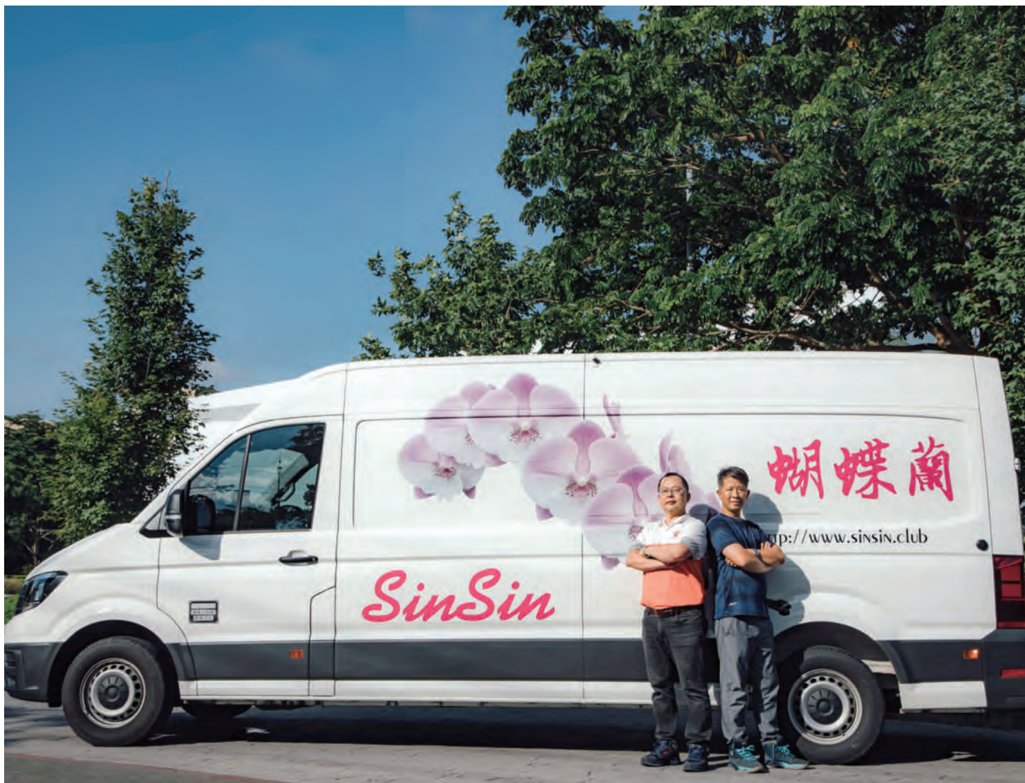
Crafter Van 強大的載運量以及平穩的路感，讓每一批蘭花苗瓶都能完美地送到客戶手上。