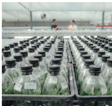
蘭花苗價值高昂，需要小心控溫、載運。