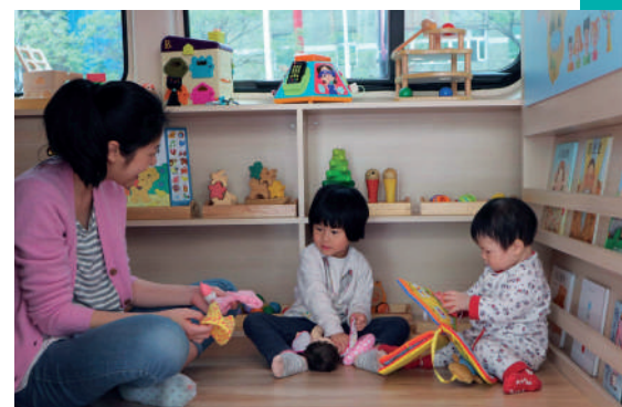
台灣玩具圖書館協會將福斯商旅 Crafter 內裝改造為玩具空間，孩子們可以在車內盡情玩樂。

裝下兩百公斤重的木頭球池，整台車裝滿滿，取出物品後，還要像變形金剛一樣化身行動遊戲場。每次維庭母親都會驚訝的問，「這些東西要全部放進來嗎？」看到協會同仁將福斯商旅車物盡其用，用到極致，才發現這樣一台車真的能裝滿玩具、更裝滿了愛！