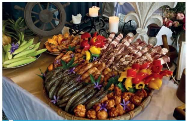
在營區內可享一泊五食的豪華享受。