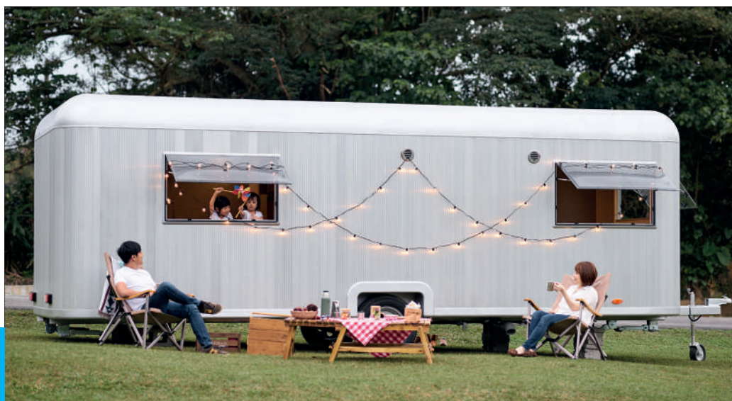
礁溪老爺酒店於五峰旗得天公園營區推出露營車體驗。

近幾年 Glamping (Glamorous Camping) 豪華露營當道，在全球掀起熱潮。不用煩惱裝備、就能輕鬆地享受戶外露營，很適合剛開始接觸露營活動的入門者！