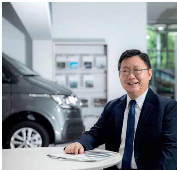
擁有多年銷售經驗的江副總，用 2 年多的時間深根宜蘭地區，拓展福斯商旅市場新藍海。

以自身駕駛 Caddy Maxi 的深刻體驗，不論是工作載著 5 至 7 位同仁一樣寬敞舒適，還是假日全家家族出遊或採買，只要一台車就能滿足日常工作及休閒所需，同車還能增加互動、促進交流，大家的感情也比以往更加融洽。江副總感受到福斯商旅極為便利的靈活使用，享受到 VanLife 可靜可動、一車兩用的「自由自在、無拘無束」，真心肯定商旅車市場應該觸及更廣、更大，因為 VanLife 不僅符合未來生活趨勢，更能為生活創造無限可能！