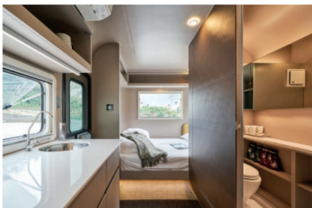
露營車內猶如入住飯店般舒適，備品一應俱全。