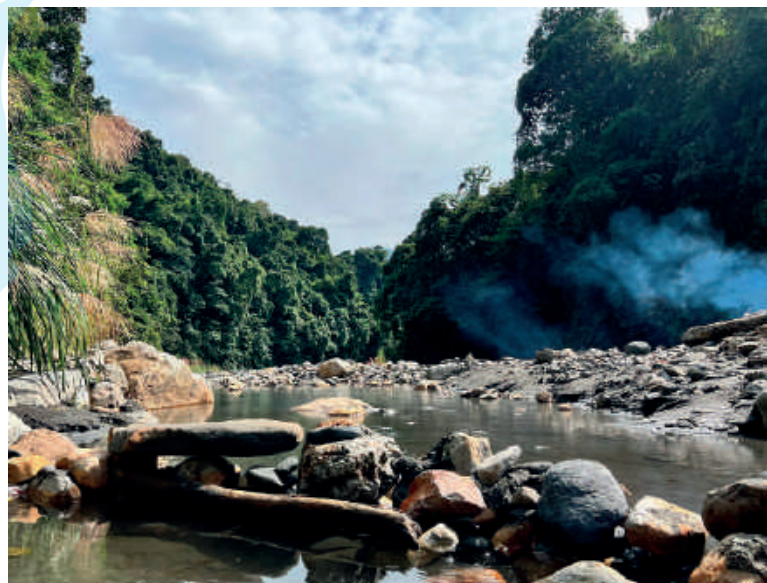
梵梵溫泉有原始山地風貌，享受野溪溫泉同時能欣賞山水風光。

將車輛停放於四季國小英士分校的停車場後，循著路旁指示牌走上長長的河堤，遠方廣闊的山景風光，令身心頓時舒暢，漫步進入唯美的溪谷，明澈的溪水緩緩流動，陽光下展現波光粼粼的姿態，兩旁鬱鬱蒼蒼的原始山林環繞，盈滿悠靜愜意的氛圍，一池池煙霧繚繞的野溪溫泉遍佈其中，雪白的霧氣升騰，彷彿抵達人間仙境。