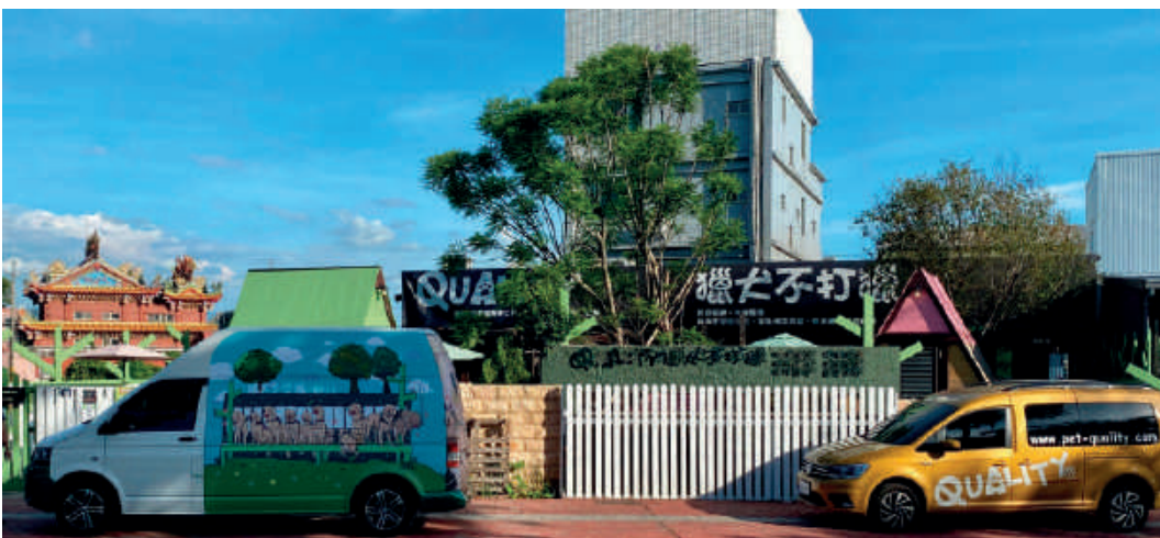
陳團長是福斯商旅愛好者，前後已入手 T6.1 Caravelle 共 3 台福斯商旅車。

全家人與 T6.1 Caravelle 最甜蜜的回憶，是團長與太太的婚紗之旅，他們包下民宿，帶著 11 隻小狗在外過夜，邊拍婚紗邊度假。「太太原本是我店裡的客人，我是因為幫她拍照而要到她的聯絡方式。」團長掩不住眼裡的笑意：「我們因為狗狗認識，所以希望拍婚紗和婚禮當天牠們都能參與。」雖然疫情影響而延後婚禮，兩人愛的結晶也即將誕生，未來一家三口加 11 隻狗寶貝，十四口同時出遊，更在福斯商旅的陪伴下，創造更多生活的美好。