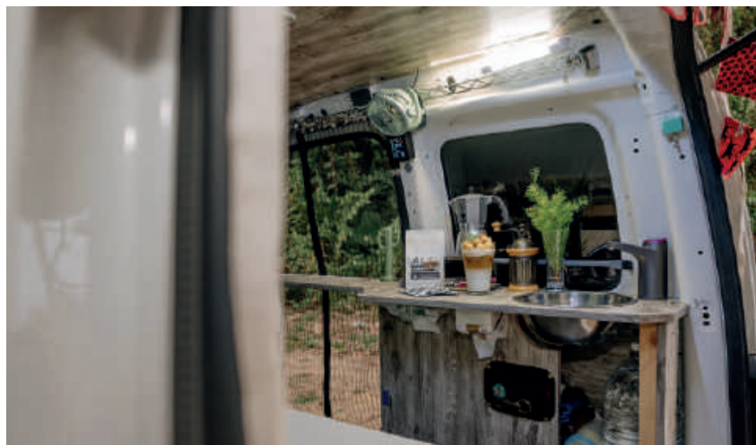
親手製作的吧檯空間，咖啡便是旅行的最佳伴侶。

週二、週三咖啡館公休，夫妻倆會在週一晚上打烊後，洗漱完就驅車直奔目的地：「光是省油這點就讓我們不用顧慮太多，有事沒事就下山外跑。」除了省油之外，因為是掛貨車牌，每年稅金可以省下一萬多元，超乎想像的高 CP 值，讓他們能輕鬆昇華樂活人生，定義屬於自己的幸福哲學。