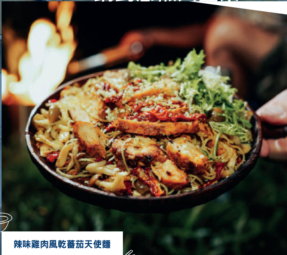
辣味雞肉風乾蕃茄天使麵