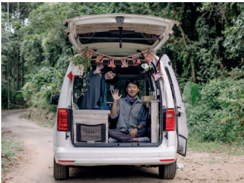
車泊的好處就是隨停隨玩，享受隨心所欲的旅行。