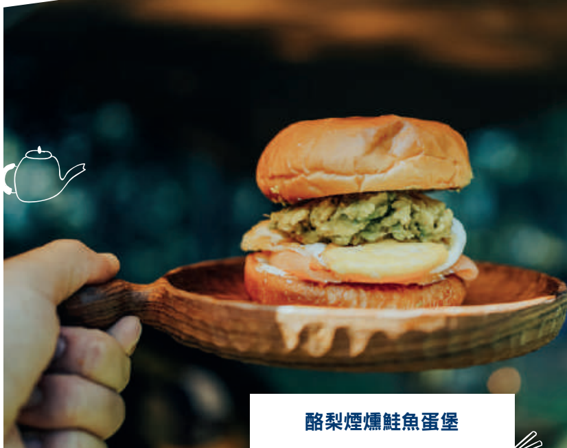
酪梨煙燻鮭魚蛋堡