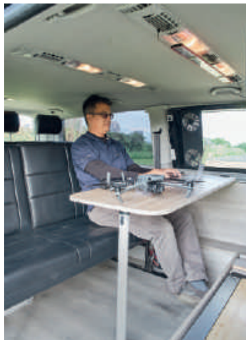
(左) 餐桌從車內延伸出來，化身行動廚房。 (右) 妥善計算空間坪效，車內搖身一變就成為行動工作室。