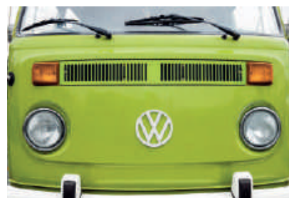
保留 1979 年原廠設計與裝置， 尊重經典老車原貌。