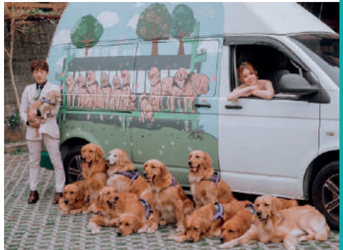
10 隻黃金獵犬、1 隻短毛臘腸即將在團長新籌備的餐廳展開新生活。夫妻倆的婚紗照，毛孩跟愛車都一起入鏡。