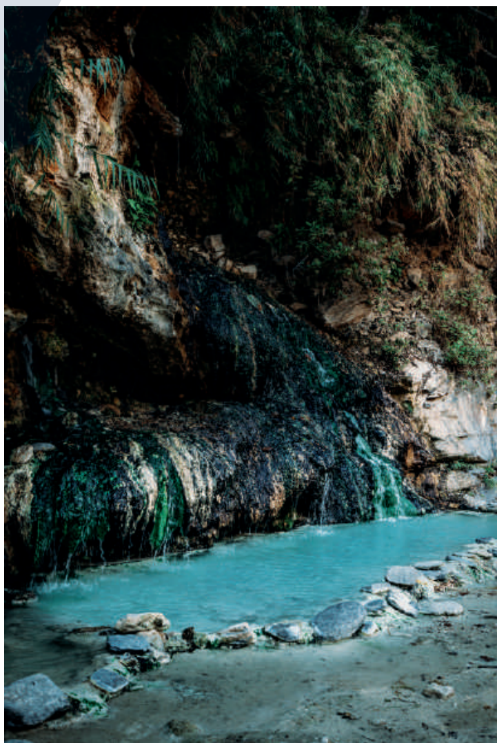
十坑溫泉建議枯水期前往，才能享受美景。

溫泉結晶遍佈池畔，綻放如玻璃般精緻透明的翠綠色，泉水自七彩的山壁汨汨流出，沉澱出大量的白色碳酸鈣結晶，經日月沖刷後，於瀑布下方緩慢堆積，交疊成乳白青綠色的牛奶池，藻類於石壁上閃爍著晶瑩剔透的光澤，化為一幅白、綠、黃交織的奇幻壁畫，有如秘境感十足的秀麗仙境，美麗豐富的景觀令人不虛此行。