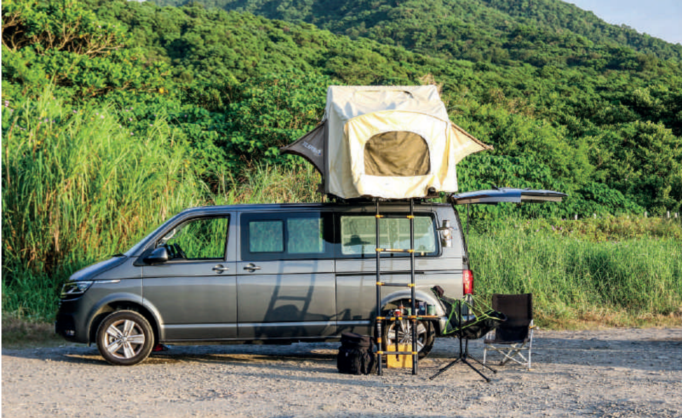
姚元浩想要以完全符合道路法規的方式，讓 T6.1 Caravelle 變身為夢幻衝浪車「Cara-fornia」！