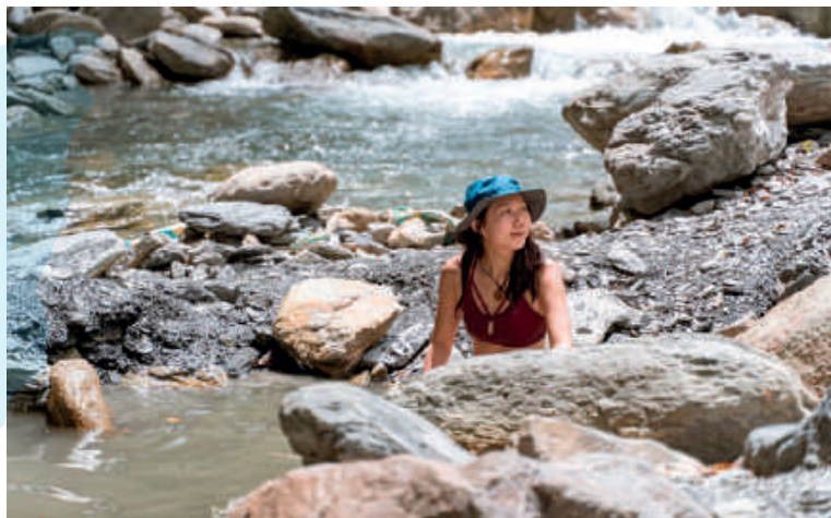
萬大北溪溫泉沿途可觀賞楓葉林、還有蔚為壯觀的溪流峽谷地形，風景美不勝收。

行經一望無際的廣闊河床，和遠方連綿的能高安東軍山巒遙遙相望，彷彿走進一幅壯闊的畫裡，每次轉彎，印入眼簾的藍天、白雲、溪谷與林蔭，交織成令人驚艷的景象。夕陽西下時，楓葉林與溪谷間的餘暉灑落，襯托著蔚為壯觀的峽谷地形，臥躺溫泉池中，聆聽溪水潺潺聲響，伴著蟲鳴鳥聲，盡情享受大自然帶來親切舒服的氛圍，一邊眺望著遠方奇巖絕壁上，如詩如畫的光影變化，高聳的彩壁與清澈見底的溪水，相映成一幅絕美的景色，讓人流連忘返，讚嘆著難以言喻的壯麗雄偉。