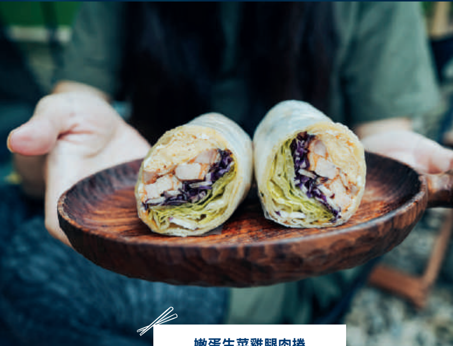
嫩蛋生菜雞腿肉捲