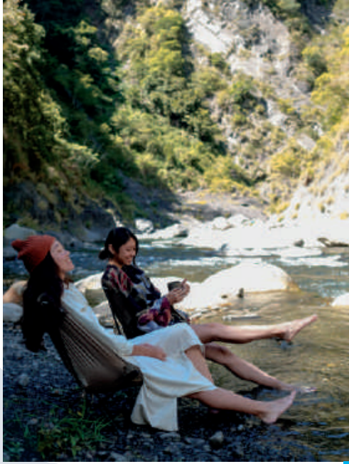
泰崗溫泉相對平坦的河床、平穩的溪水，較適合新手來挑戰。