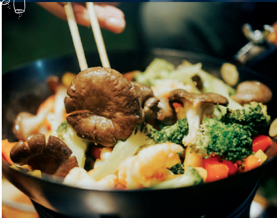
霜降平菇蝦仁炒鮮蔬