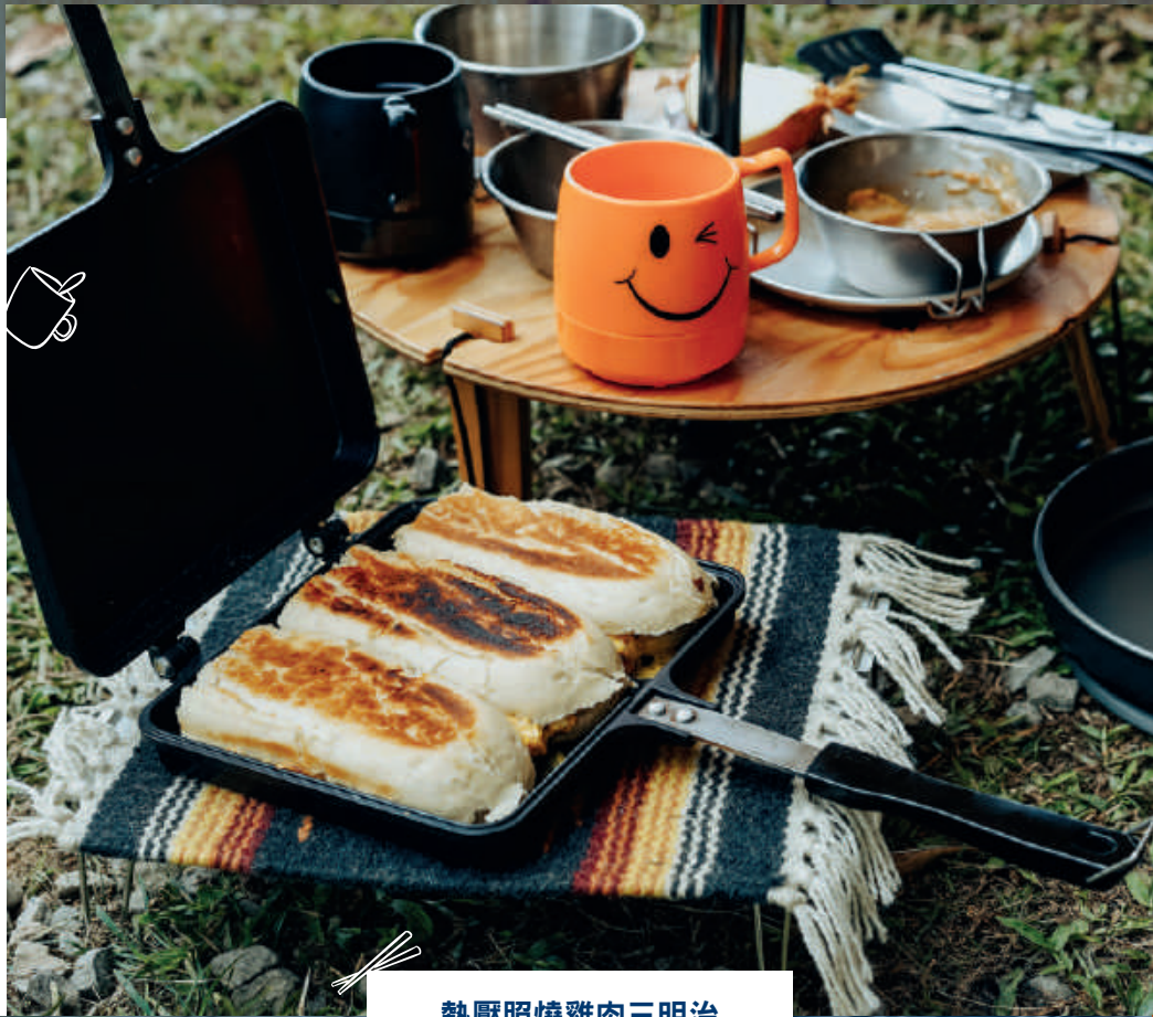
熱壓照燒雞肉三明治