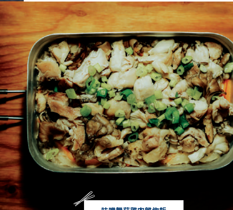
味噌舞菇雞肉雜炊飯