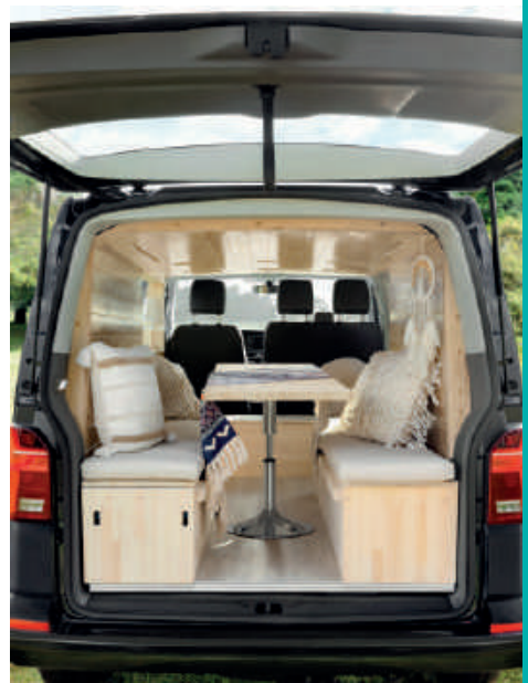
抽取式夾層平時不額外佔用空間，在必要時可變成簡易廚房。歐洲風格木作內裝，散發溫暖氛圍與極佳質感。

用縱列方向安裝的長椅，除了質感相當出眾，並分別導入了抽取式夾層與隱藏式置物櫃，各自能以抽取方式提供附有水槽的簡易流理檯以及儲藏寢具、小型座椅等輕探險用具所需要的空間，使用起來十分便利。